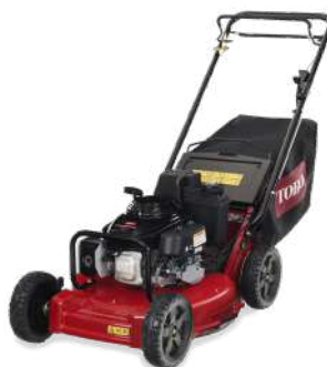
Pro 53 II