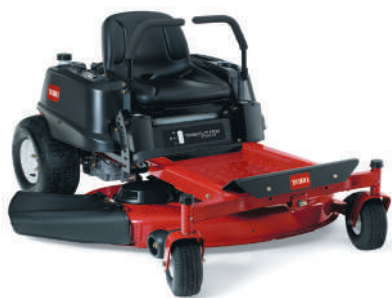
Z 4200 Single