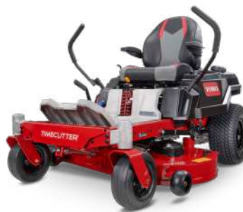
Z 4200 MyRIDE®