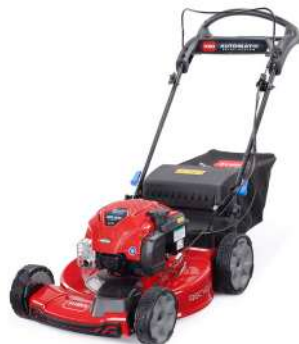
550C REC Full Equip