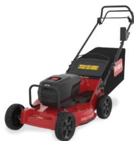
e-Pro 53 BAT