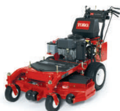
Pistol Grip rotativa