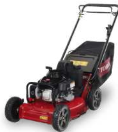
Pro 53 II