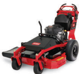
Prp 112 Hydro