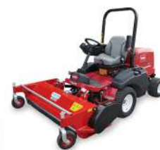
GM 3300 + desbrozadora