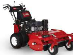
Pistol Grip martillo